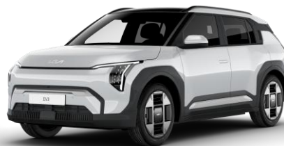
Snow White (SWP) metalizowany