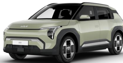
Aventurine Green (AG3) metalizowany