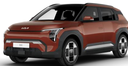
Terra Cotta (TCT) metalizowany bez dopłaty