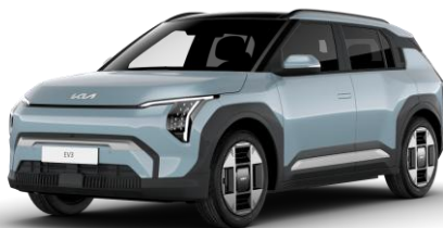
Frost Blue (EBB) pastelowy