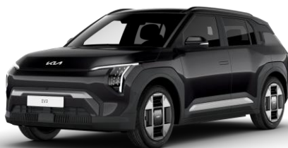
Aurora Black (ABP) metalizowany