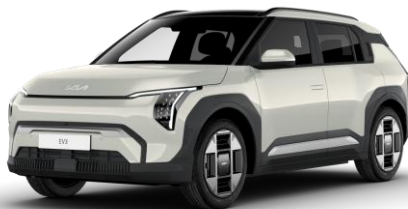
Ivory Silver (ISG) metalizowany