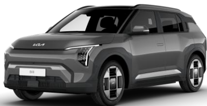
Shale Grey (EBD) metalizowany