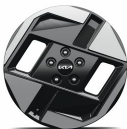
17" felgi aluminiowe Air i Earth