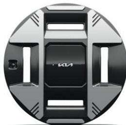
19" felgi aluminiowe Business Line