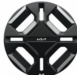
19" felgi aluminiowe GT Line